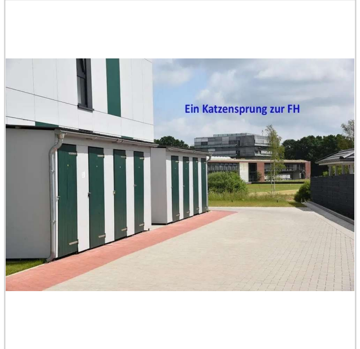
Der Katzensprung zur FH