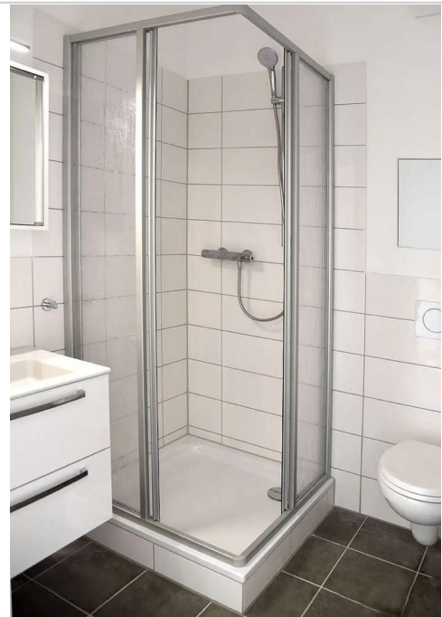
Duschbad mit Kabine