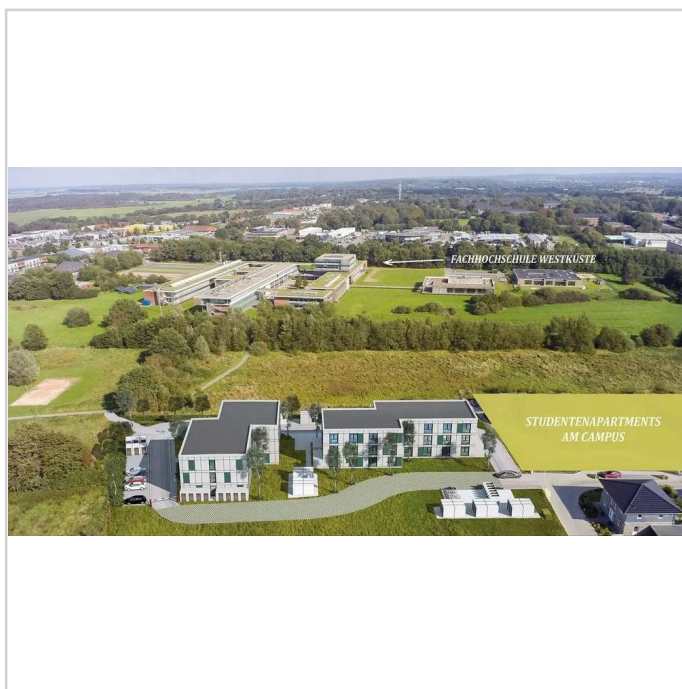
Übersicht / Lage