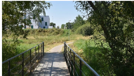
Von der FH nach Hause